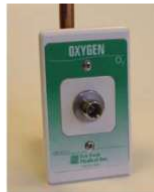
XF5724A con placa de montaje XC1000-10

Las salidas de gases medicinales se limpiarán para usarse con oxígeno de acuerdo con el Folleto G-4.1 de la Compressed Gas Association (Asociación de Gases Comprimidos, CGA). Tendrán tapón y envase protector para su envío. Las salidas se instalarán en estricta conformidad con las instrucciones del fabricante y antes de su uso, se probarán conforme a la norma NFPA 99 y a los códigos locales y estatales.